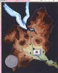
上毛かるた原画(当館蔵)

上毛かるたに読み込まれる群馬県の歴史・自然等から群馬とは何か、群馬の県民性にせまります。