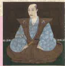
織田信長像(部分) (大徳寺蔵)