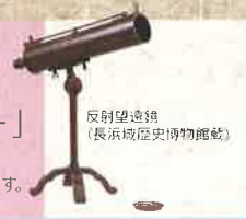
反射望遠鏡 (長浜城歴史博物館蔵)

国宝伊能図、群馬初上陸!関孝和や伊能忠敬など、江戸時代の科学者たちの研究成果と実像に迫ります。