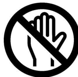
展示物、ガラスケース、 壁にさわらない