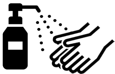
手指の消毒をする