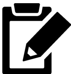
申告書を記入する