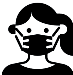
マスクを着用する