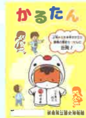
ワークブック リニューアルします!