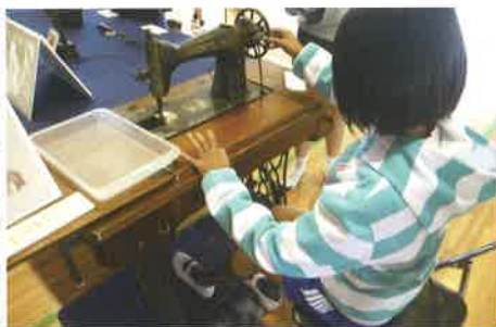
足で踏んだら針が動いた！