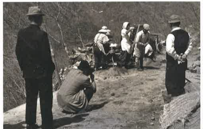
群馬ニュース第1号の撮影風景[写真]

この写真は、昭和32(1957)年に制作された「群馬ニュース」の撮影風景です。「群馬ニュース」は、県の企画で制作された県政映画で、県内の映画館で上映され広報に活用されました。映像には、昭和30年代から40年代にかけての県内の出来事や、当時の生活環境など、さまざまな同時代の様子が記録されています。これらは、展示室に設置したミニシアターで、ご覧いただけます。