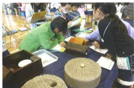
どうやって削るのかな？