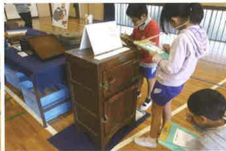
ここに氷を入れるんだね