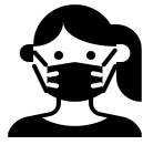
マスクを着用する