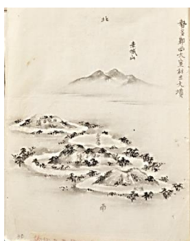
描かれた大室古墳群 (群馬県立文書館蔵「古書古器物書類」より)

明治期に発掘された前二子古墳 (前橋市) と築瀬二子塚古墳 (安中市) について、当時の状況とその後の発掘調査の経過までを含めて、お二人の講師が解説します。