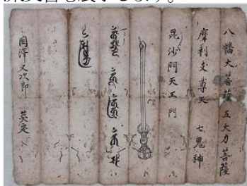
呪符 (岡澤文書、茨城県指定文化財 個人蔵)