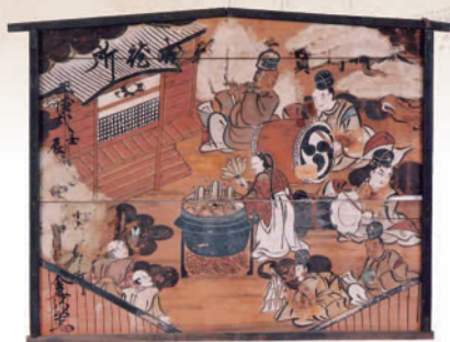
日向見薬師堂絵馬 (宗本寺)