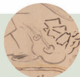
江戸時代の絵図に残る温泉マーク資料も展示