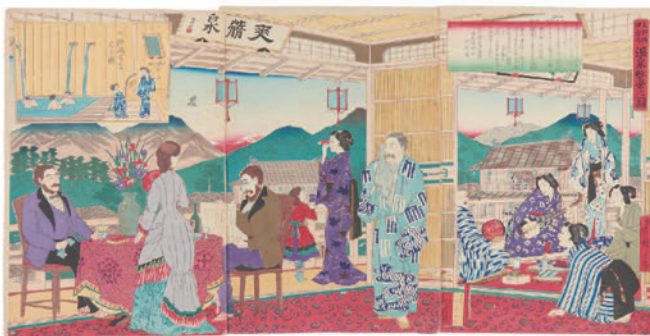
上野国伊香保温泉繁栄之図