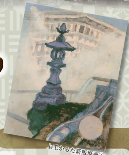
上毛かるた新版原画