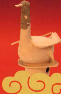
所蔵：新田荘歴史資料館