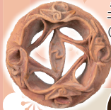
土製耳飾 (桐生市教育委員会蔵)