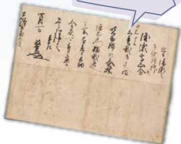
藤岡市下日野黒澤文書《平澤政実書状》