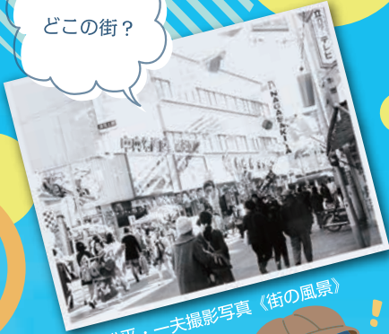
平田松平・一夫撮影写真《街の風景》