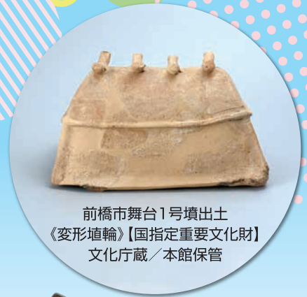
前橋市舞台1号墳出土 《変形埴輪》【国指定重要文化財】 文化庁蔵／本館保管

最近、埴輪がブームになっています。刀剣のブームも続いているようです。でもマニア以外の方にとって、埴輪や刀剣の情報もう少しあれば、展示資料をさらに一歩踏み込んで見ることや楽しむことができます。本展は今まで興味がなかった時代、または素通りしていた展示コーナーなどに、少しでも興味や関心を持っていただこうと企画しました。展示資料についての素朴な疑問を想定し、目からウロコの見かたを紹介します。ただ観覧するのではなく、自分なりの疑問や好奇心をもって博物館資料を見ていただき、その楽しさをお伝えできればと思っています。またブームに乗って、本館が収蔵する貴重な埴輪も展示します。どうぞお楽しみください。