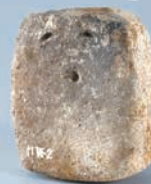
前橋市西新井遺跡出土 《土版》