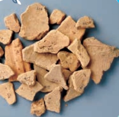
高崎市不動山古墳出土 《円筒埴輪片》