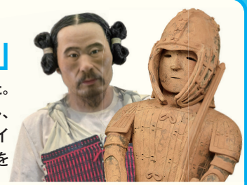
ヨロイを着た古墳人 国宝 復元CG 埴輪 挂甲の武人(部分) (東京国立博物館蔵)

【観覧料】一般1,200円、大学生・高校生600円、中学生以下無料(常設展も観覧できます。)